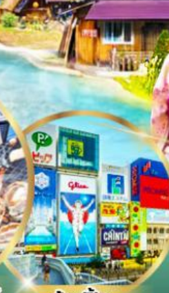
ช้อปปิ้ง ย่านชินโซบาสึ