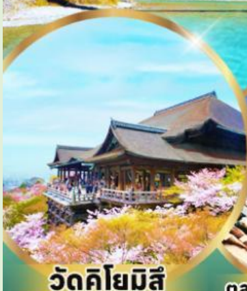
วัดคิโยมิสึ