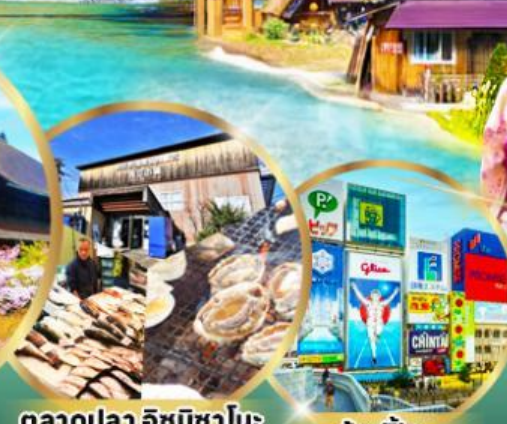
ตลาดปลา อิซุมิซาโนะ