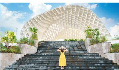
สวนเอเปค