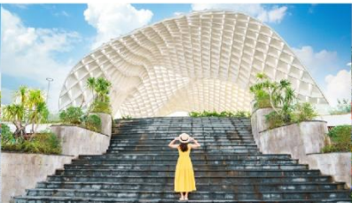
สวนเอเปค