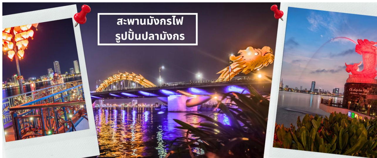
สะพานมังกรไฟ รูปปั้นปลามังกร

จากนั้นนำท่านชม สะพานแห่งความรัก ที่นิยมของหนุ่มสาวคู่รักกันมาชื่อฤกษ์แจใสคล้องใส่สะพาน จากนั้นนำท่านชม รูปปั้นปลามังกร ที่เป็นสัญลักษณ์ของเมืองดานัง เมืองที่กำลังจะกลายเป็นมังกรในระยะใกล้แห่งเอเชียตะวันออกเฉียงใต้ เชิญท่านเพลิดเพลินกับความอลังการของ สะพานมังกรไฟ ที่มีความยาวถึง 666 เมตร เป็นสะพาน 6 เลนส์ ซึ่งเป็นสะพานที่ตระการตามากที่สุดของเวียดนามในเวลานี้โดยการแสดงนี้จะเริ่มเวลา 21.00น. ของวันเสาร์และอาทิตย์เท่านั้น