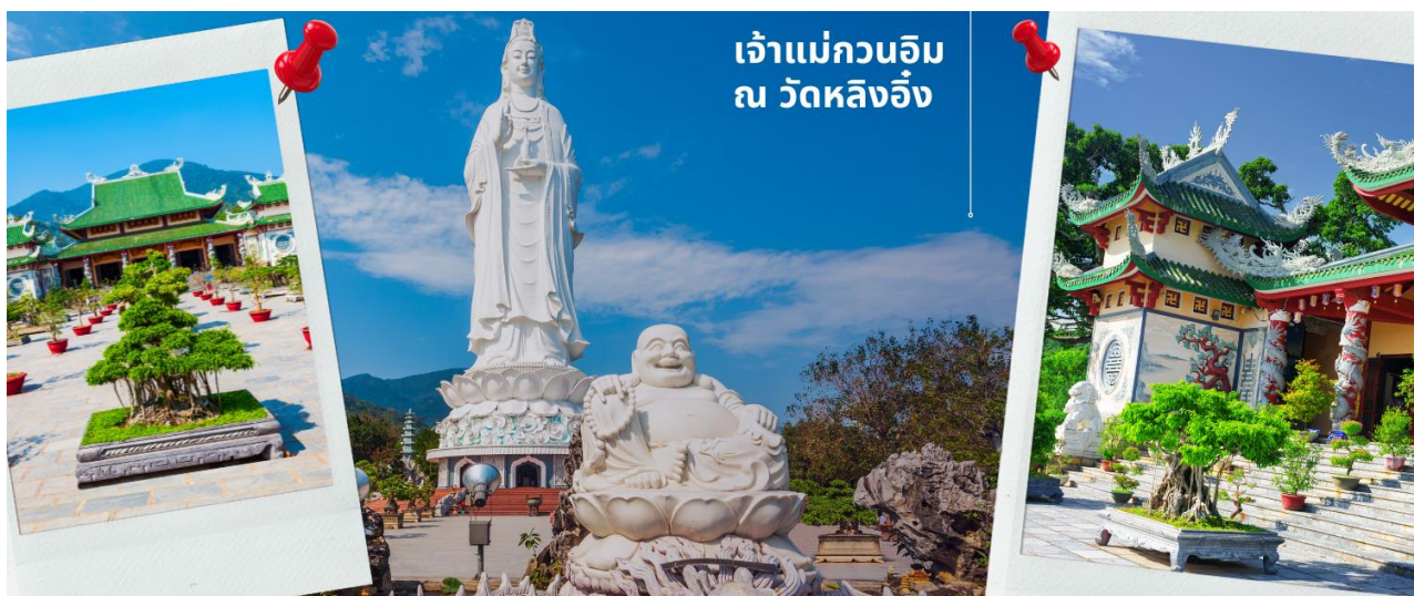
เจ้าแม่กวนอิม ณ วัดหลังอิง

นำท่านมีสการองค์ เจ้าแม่กวนอิม ณ วัดหลังอิง อยู่บนเกาะเซ็นตรา (Son Tra) ทางเหนือของเมืองดานัง เป็นวัดใหญ่ที่สุดของที่นี่ รูปปั้นปูนขาวของเจ้าแม่กวนอิมยืนหันหลังให้ภูเขา หันหน้าออกสู่ทะเลเพื่อเป็นการปกป้องคุ้มครองชาวประมงที่ออกไปหาปลา เสียงระฆังวัดที่ตีประสานกับเสียงคลื่นนั้นช่วยให้ชาวเรือรู้สึกสงบ