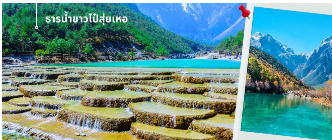
ธารน้ำขาวไปสู่หือ

นำท่านชม ธารน้ำขาวไปสู่หือ หรือ ทะเลสาบไปสู่หือ (รวมค่าบริการรถแบดเตอร์) ทะเลสาบสีเทอร์ควอยซ์ตัดกับวิวต้นไม้ท่ามกลางขุนเขาแห่งหุบเขาพระจันทร์สีน้ำเงิน ฉากของภูเขาหิมะมังกรหยก มีน้ำตกหินปูนชั้นบันไดขนาดเล็กลดหล่นลงมาอย่างสวยงาม น้ำที่ไหลผ่านหุบเขานี้คือน้ำที่ละลายจากหิมะบนยอดเขาหิมะมังกรหยก เนื่องจากจุดนี้มีทิวทัศน์ที่สวยงามมีฉากหลังคือภูเขาหิมะมังกรหยกมีน้ำตกและแม่น้ำที่ทะเลสาบจึงเป็นที่นิยมของนักท่องเที่ยวช่างภาพและคู่รักเป็นอย่างมาก อิสระเก็บภาพประทับใจตามอัธยาศัย