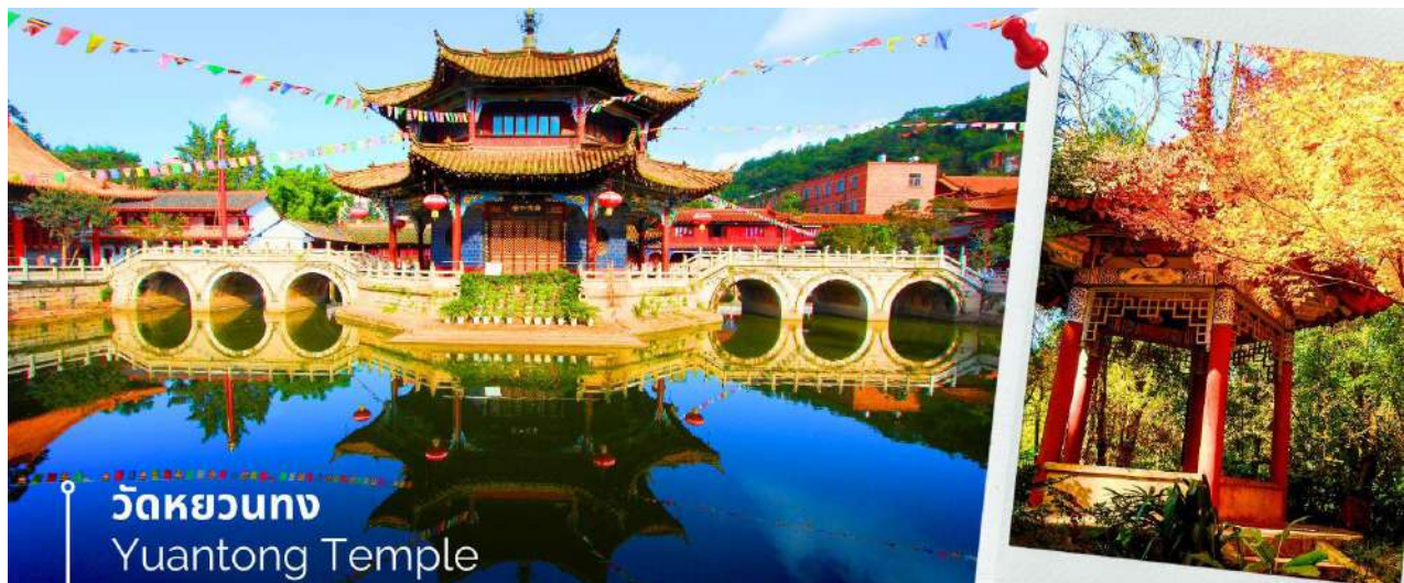
วัดหยวนทง Yuantong Temple

นำท่านชม วัดหยวนทง (Yuantong Temple) วัดแห่งนี้เป็นวัดที่ใหญ่และเก่าแก่ที่สุดในเมืองคุนหมิง สร้างมาตั้งแต่สมัยราชวงศ์ถัง มีอายุยาวนานประมาณ 1,200 กว่าปี การสร้างวัดแห่งนี้จะแปลกตากว่าวัดอื่นในจีน เพราะปกติแล้วการสร้างวัดของจีนส่วนมากจะต้องสร้างอยู่บนภูเขา แต่วัดหยวนทงสร้างวัดต่ำกว่าภูเขา โดยวิหารจะอยู่ต่ำที่สุด เนื่องจากวัดแห่งนี้ไม่ได้สร้างขึ้นเพื่อเป็นวัดโดยตรง แต่เคยเป็นศาลเจ้าแม่กวนอิมมาก่อน