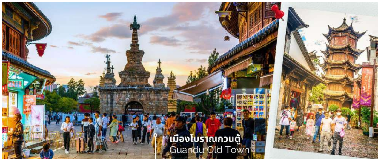
เมืองโบราณกวนตุ๋ Guandu Old Town

นำท่านชมบรรยากาศ เมืองโบราณกวนตุ๋ (Guandu Old Town) เป็นหนึ่งในต้นกำเนิดของวัฒนธรรมยูนนาน และยังเป็นหนึ่งในภูมิทัศน์ทางประวัติศาสตร์และวัฒนธรรม ที่สำคัญของเมืองคุนหมิง เมืองโบราณแห่งนี้ยังคงเป็นศูนย์กลางทางการค้าและคมนาคมที่สำคัญ ในอดีตเคยเป็นหมู่บ้านชาวประมงในสมัยราชวงศ์ถัง เมืองกวนตุ๋ยังเป็นเมืองแรกๆ ที่ศาสนาพุทธทางไนทิเบตได้เริ่มเผยแพร่เข้ามาในดินแดนยูนนาน