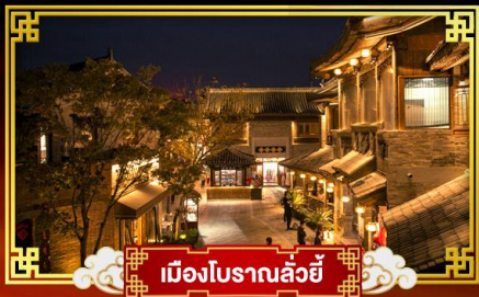
เมืองโบราณลั่วหยี่