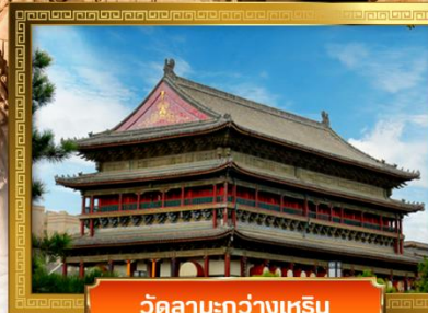
วัดลามะ-กว่างเหริน

เดินทางโดย: สายการบินเซินเจิ้นแอร์ไลน์ (ZH)