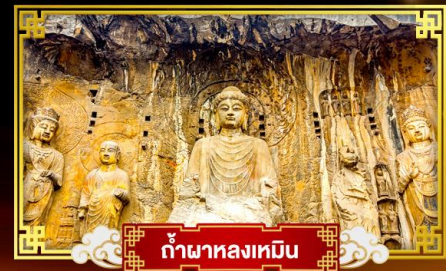
กำฟ้าหลงเหมิน