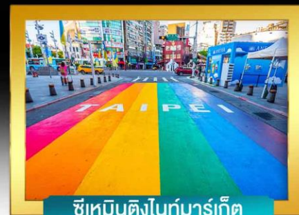
ซีเหมินติงไนท์มาร์เก็ต