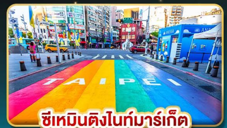
ซีเหมินติงโก๋มาร์เก็ต