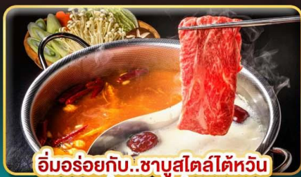
อิ่มอร่อยกับ..ชาบูสไตล์ไต้หวัน เมนูหม้อนึ่งจักรพรรดิ เสียวหลงเปา