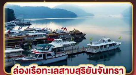
ล่องเรือทะเลสาบสุริยจีนตรา