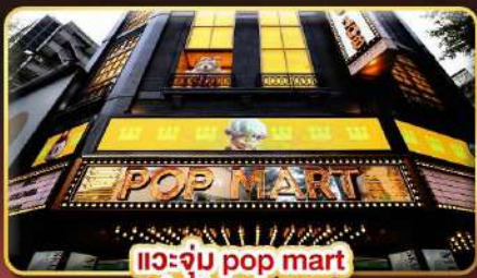
แวะจุ่ม pop mart ที่ฮิตที่สุดในซีเหมินติง