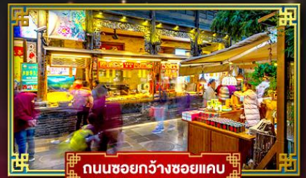
ถนนชอยกวางชอยแคบ