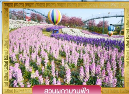
สวนพกาบานฟ้า