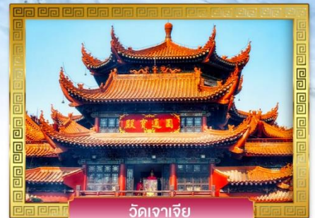
วัดจาเจีย