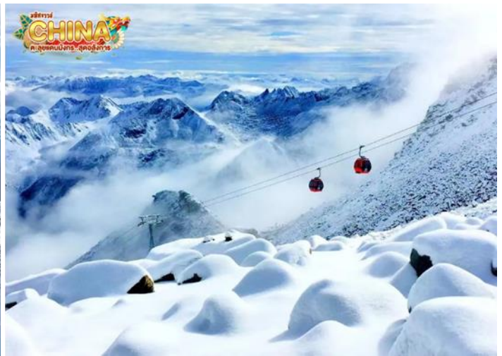
(หมายเหตุ: ปริมาณหิมะขึ้นอยู่กับสภาพอากาศ)

กลางวัน ๑๑ บริการอาหารกลางวัน ณ ภัตตาคาร