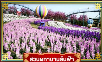
สวนผกาบานล้นฟ้า

อุทยานสวรรค์ภูผาหิมะการ์เซียต้ากู่ปิงชว่น