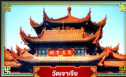
วัดจาเจีย