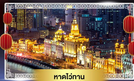
หาดว่อกาน