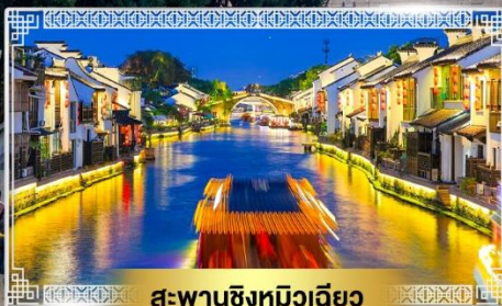
สะพานชิงหมิงเจียว