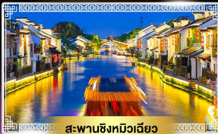
สะพานชิงหวีเวี๊ยว