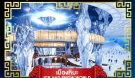
เมืองหิมะ ICE AND SNOW WORLD