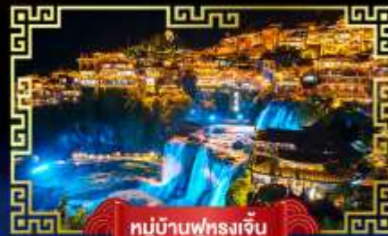
หมู่บ้านฟูรงเจิน