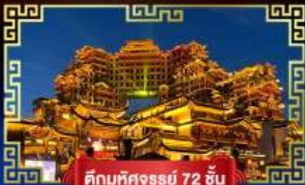
ตึกมหัศจรรย์ 72 ชั้น