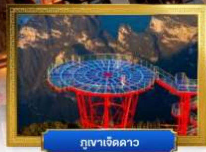
ภูเขาเจ็ดดาว