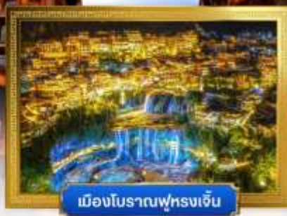
เมืองโบราณฟูหรงเจิ้น