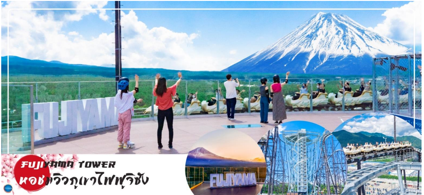
FUJIYAMA TOWER หอคอยภูเขาไฟฟูจิ

ได้เวลาอันสมควรนำท่านเดินทางสู่ เมืองนาริตะ (Narita) (ใช้เวลาเดินทางประมาณ 2.30 ชั่วโมง) นำท่านเดินทางสู่ อโอน มอลล์ นาริตะ (Aeon Narita Mall) ห้างสรรพสินค้าที่นิยมในหมู่นักท่องเที่ยวชาวต่างชาติ เนื่องจากตั้งอยู่ใกล้กับสนามบินนานาชาตินาริตะ ภายในตกแต่งในรูปแบบที่ทันสมัยสไตล์ญี่ปุ่น มีร้านค้าที่หลากหลายมากกว่า 150 ร้านจำหน่ายสินค้าแฟชั่น อาหารสดใหม่ และอุปกรณ์ภายในบ้าน นอกจากนี้ยังมีร้านเสื้อผ้าแฟชั่นมากมาย เช่น MUJI, 100 yen shop, Sanrio store, Capcom games arcade และซูเปอร์มาร์เก็ตขนาดใหญ่