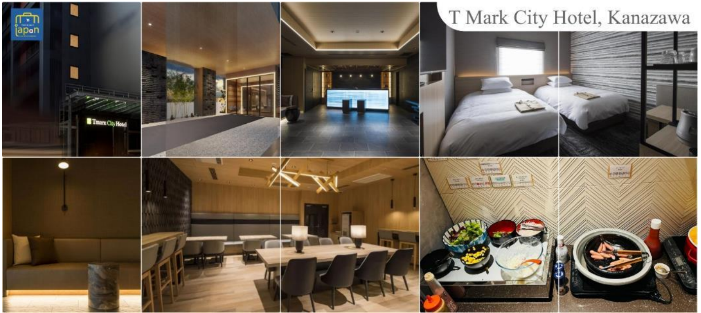
T Mark City Hotel, Kanazawa

เย็น รับประทานอาหารเย็นอิสระตามอัธยาศัย พักที่ T MARK CITY HOTEL, KANAZAWA หรือเทียบเท่าระดับเดียวกัน