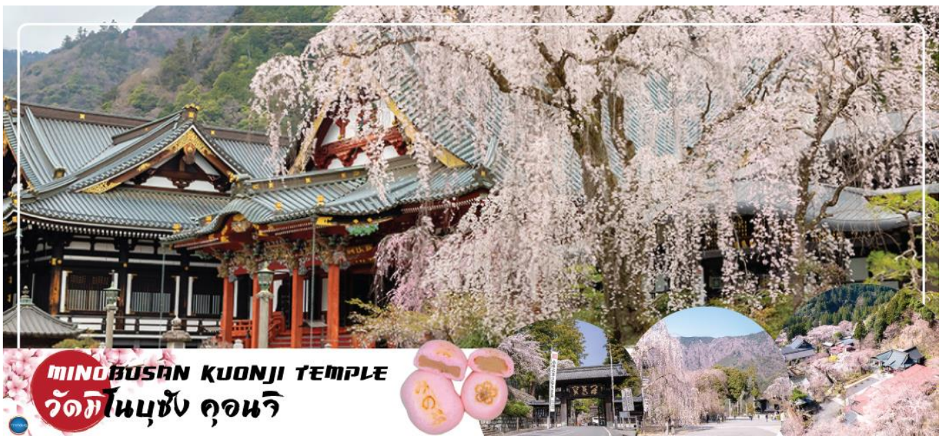
MINO BUSAN KOENJI TEMPLE วัดมิโนบุซัง คองจิ