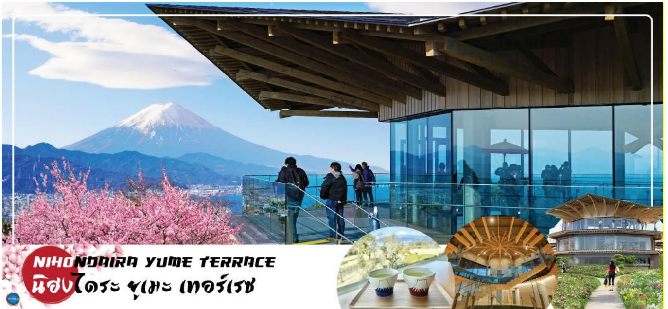
NIHONDAIRA YUME TERRACE นิสงไดระ ยูเมะ เทอร์เรซ

วันที่สาม เมืองนาโกย่า – จังหวัดชิซุโอกะ – นิสงไดระ ยูเมะ เทอร์เรซ – เมืองยามานาชิ – วัดมิโนบุซังคองจิ(จุดชมซากุระขึ้นกับภูมิกากาต) – กระเช้าไฟฟ้ามิโนบุซัง – ออนเซ็น + ชาบูยักษ์