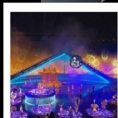
โชว์ ENCOUNTER WITH WUYUAN