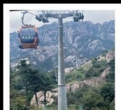
เจาหลิงซาน