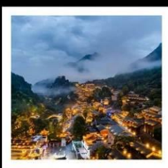
หุบเขาเทวดาฉางเจียนกู่