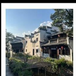
หมู่บ้านสุขุม่อช่างเหอ