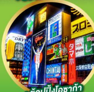
• ช้อปปิ้งโอซาก้า

เส้นทางสายอัลไพน์ทาเคยาม่า (Japan Alps Snow wall)