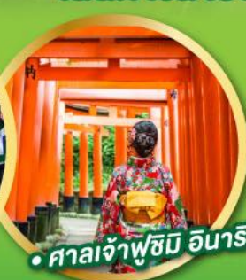
• ศาลเจ้าฟูชิมิ อินาริ