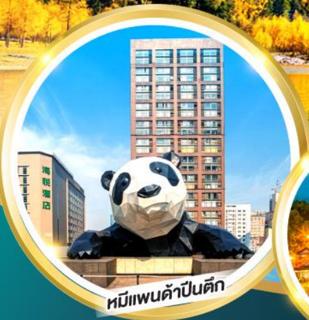
หมีแพนด้าป็นตึก