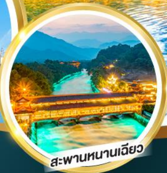
สะพานหนานเฉียว