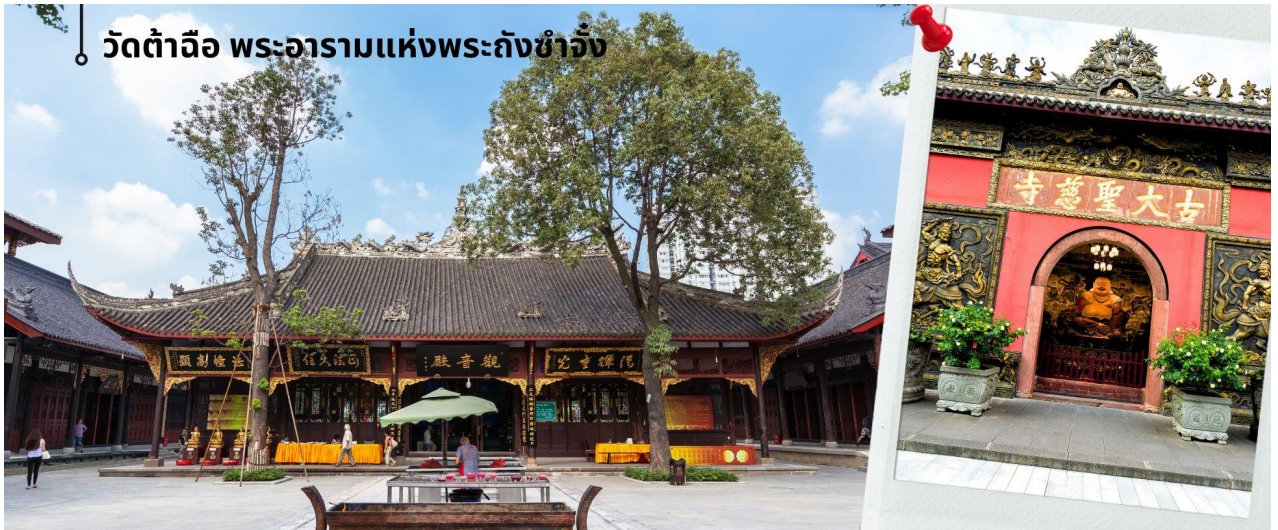
📍 วัดต้าฉือ พระอารามแห่งพระถังซำจั๋ง

นำท่านชม วัดต้าฉือ พระอารามแห่งพระถังซำจั๋ง ไฉกลางนครเฉิงตู พระถังซำจั๋ง ได้รับการสรรเสริญว่าเป็นผู้มีความเพียร และมีชื่อเสียงมายาวนานกว่า 1,400 ปี และยังได้รับการยกย่องว่าเป็น พระไตรปิฎกแห่งราชวงศ์ถัง พุทธประวัติของพระถังซำจั๋งถูกจารึกในสถานที่ต่างๆมากมาย รวมไปถึงได้ถูกกล่าวถึงในจดหมายเหตุหลายเล่ม ตามเส้นทางการเดินทางแห่งความเพียรของท่าน รวมทั้งมีพระอัฐิของท่าน ประดิษฐานอยู่ในพระอารามของนครนานจิง และที่ทะเลสาบสุริยันจันทราเป็นเกาะไต้หวันอีกด้วย