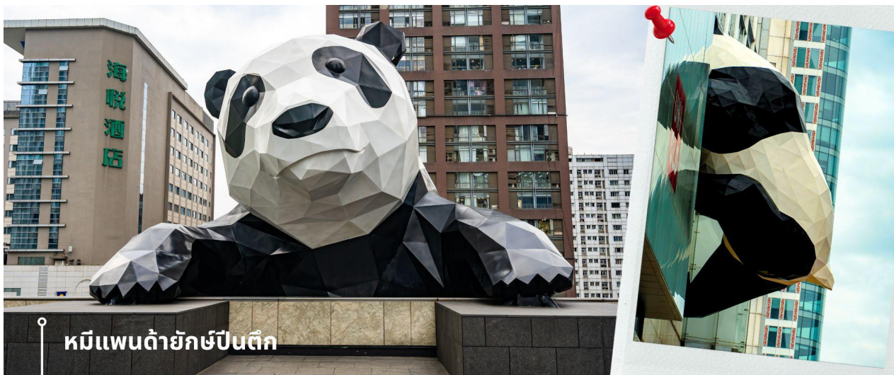
หมีแพนด้ายักษ์ปิ่นตึก

ปิ่นตึก และมีส่วนหัวที่โผล่พ้นออกมาจากอาคาร ทำให้เกิดภาพอันน่ารักและน่าประทับใจจากผู้ที่พบเห็นและนักท่องเที่ยว