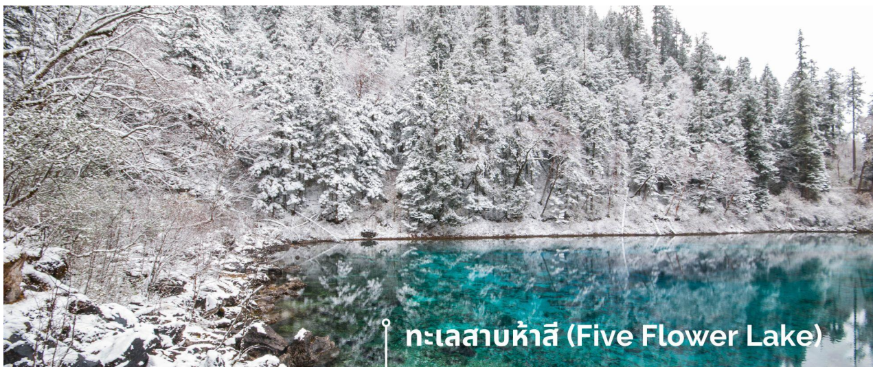
ทะเลสาบห้าสี (Five Flower Lake)

หนึ่งในจุดที่สวยงามและนักท่องเที่ยวแห่มาเยี่ยมชมเยอะที่สุด ตั้งอยู่ที่ความสูงเหนือระดับน้ำทะเลประมาณ 2,472 เมตร น้ำลึกประมาณ 5 เมตร น้ำใสจนเห็นพื้นด้านล่างของทะเลสาบ สีของผืนน้ำสวยงามแปลกตา โดยเฉพาะเมื่อยามแสงอาทิตย์สาดส่องกระทบผิวน้ำ สีของน้ำในทะเลสาบจะสะท้อนเป็นสีส้มถึง 5 เฉดสี สวยงามสะกดตา ซึ่งสาเหตุที่ทำให้เกิดสีส้มต่างๆ นี้มาจากการสะสมของแร่ธาตุ และพืชน้ำชนิดต่างๆ โดยจะมีสีส้มแตกต่างกันไปตามฤดูกาลและช่วงเวลา ยิ่งถ้ามาในช่วงฤดูหนาว ต้นไม้ริมทะเลสาบจะเต็มไปด้วยหิมะสีขาวตัดกับสีของทะเลสาบ ดูสวยงามแปลกตา