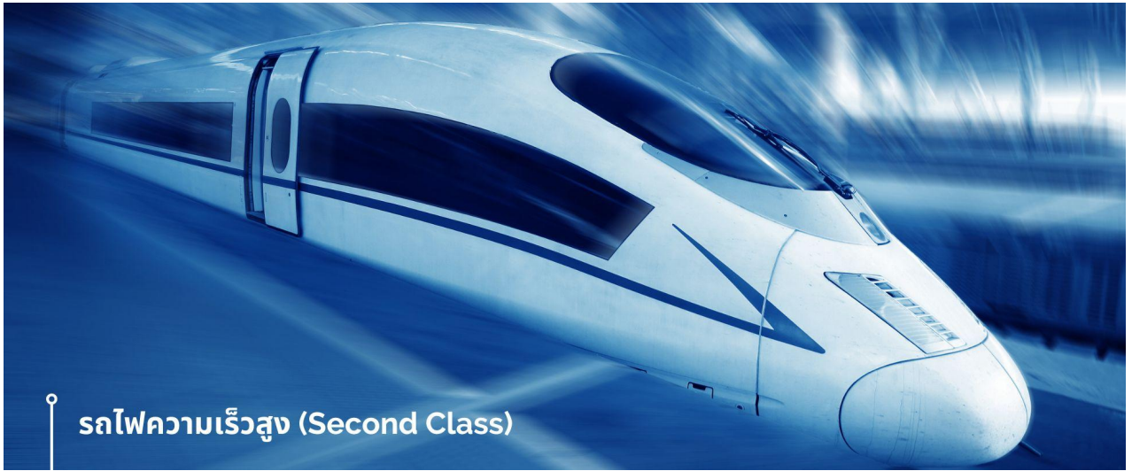
📍 รถไฟความเร็วสูง (Second Class)

นำท่านเดินทางสู่สถานีรถไฟ เพื่อเดินทางด้วย รถไฟความเร็วสูง (Second Class)