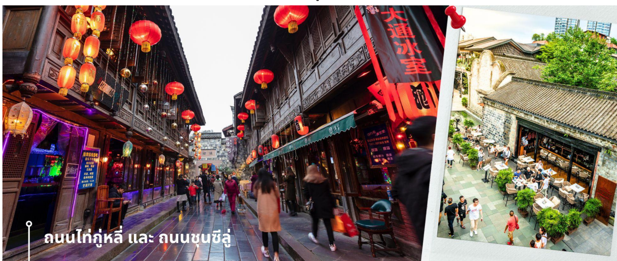
ถนนไท่กู่หลี่ และ ถนนซุนซิวี่

จากนั้นให้ท่านให้อิสระกับการเลือกซื้อสินค้าของฝากที่ ถนนไท่กู่หลี่ และ ถนนซุนซิวี่ ในย่านนี้เป็นถนนโบราณ ในอดีตเคยโรงงานผลิตผ้าไหมใหญ่ที่สุดในจีน ปัจจุบันได้เปลี่ยนเป็นถนนช้อปปิ้งแหล่งสวรรค์ของนักท่องเที่ยว เป็นถนนคนเดิน มีห้างสรรพสินค้าชื่อดัง มีร้านค้ามากกว่า 700 ร้านค้าที่เต็มไปด้วยสินค้าต่าง ๆ ทั้งร้านค้าแฟชั่น ร้านอาหารและโรงแรมนานาชาติมากมายซึ่งเป็นที่ยอดนิยมที่มีการเชื่อมต่อทางวัฒนธรรมท้องถิ่นที่เป็นแหล่งช้อปปิ้งและเป็นแหล่งร้านอาหารที่อร่อยต่าง ๆ มากมาย ซึ่งเป็นสถานที่เที่ยวของเฉิงตูที่ทำให้เพลิดเพลินกับสินค้าแบรนด์เนมและแบรนด์จีน