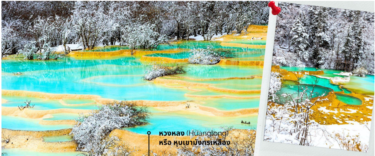
หวงหลง (Huanglong) หรือ หุบเขามังกรเหลือง

หวงหลง (Huanglong) หรือ หุบเขามังกรเหลือง (รวมค่ากระเช้าขึ้น-ลง หวงหลงและรถแบดเตอร์) ที่ได้รับการขึ้นทะเบียนเป็นมรดกโลก รายล้อมไปด้วยแอ่งน้ำสีฟ้าจำนวนนับไม่ถ้วน และภูเขาสูงใหญ่สลับซับซ้อน อุทยานหวงหลง (Huanglong Scenic and Historic Interest Area) หรือ หุบเขามังกรเหลือง แหล่งธรรมชาติที่อุดมสมบูรณ์บนเทือกเขา Minshan Mountains มีระบบนิเวศที่หลากหลาย ทั้งน้ำพุร้อน น้ำตก แอ่งน้ำหินปูน รวมถึงเป็นแหล่งของพืชพรรณนานาชนิด และสัตว์ป่าใกล้สูญพันธุ์อย่าง แพนด้ายักษ์ และ ลิงจมูกเขียดสีทอง เป็นต้น ที่สำคัญยังมีทัศนียภาพที่สวยงามน่าทึ่งราวกับเป็นดินแดนสวรรค์ ด้วยคุณสมบัติเหล่านี้ อุทยานหวงหลงจึงได้รับการขึ้นทะเบียนเป็นมรดกโลกโดยองค์การ UNESCO เมื่อปี ค.ศ. 1992