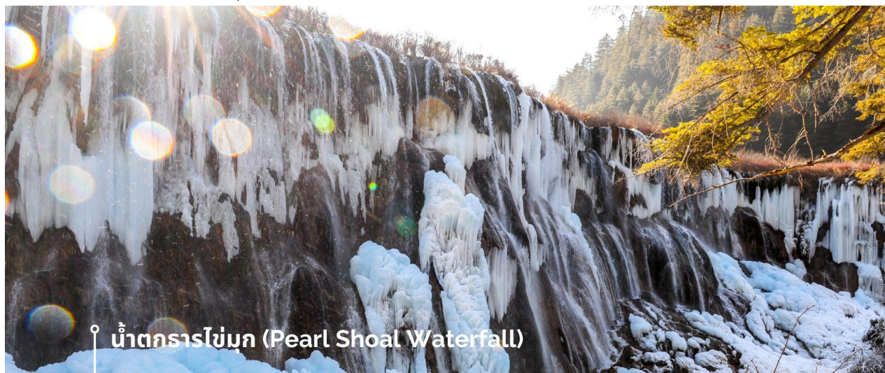
น้ำตกธารไข่มุก (Pearl Shoal Waterfall)

จากแสงแดดที่สะท้อนกับละอองน้ำอีกด้วย หากได้มาในช่วงฤดูหนาว ก็จะได้เห็นหิมะเกาะตามต้นไม้ โขดหิน และถ้าอากาศหนาวมากๆ น้ำที่น้ำตกก็จะกลายเป็นน้ำแข็ง กลายเป็นประติมากรรมจากธรรมชาติที่สวยงาม