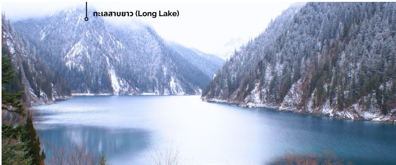
ทะเลสาบยาว (Long Lake)

ทะเลสาบที่ใหญ่ที่สุด สูงที่สุด และลึกที่สุดในจิวจ้ายโกว ด้วยเนื้อที่กว่า 581 ไร่ ความยาวกว่า 7 กิโลเมตร และลึกถึง 103 เมตร ทอดตัวโค้งเป็นรูปพระจันทร์เสี้ยว เนื่องจากหิมะบนภูเขาละลายลงมา น้ำในทะเลสาบสีฟ้าสวยงาม ล้อมรอบด้วยยอดเขาสูงชัน และต้นไม้ใหญ่ที่ปกคลุมด้วยหิมะ งดงามราวหลุดออกมาจากภาพวาด ความพิเศษในช่วงฤดูหนาว ทะเลสาบจะกลายเป็นน้ำแข็งหนากว่า 60 เซนติเมตร ทำให้นักท่องเที่ยวนิยมมาเล่นสกีที่น้ำแข็งกันเป็นจำนวนมาก