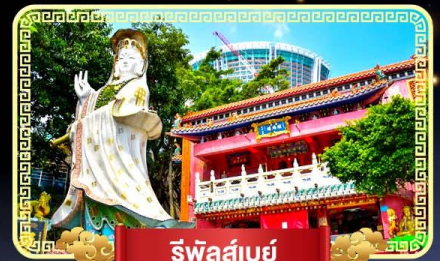
ริพัลส์เบย์