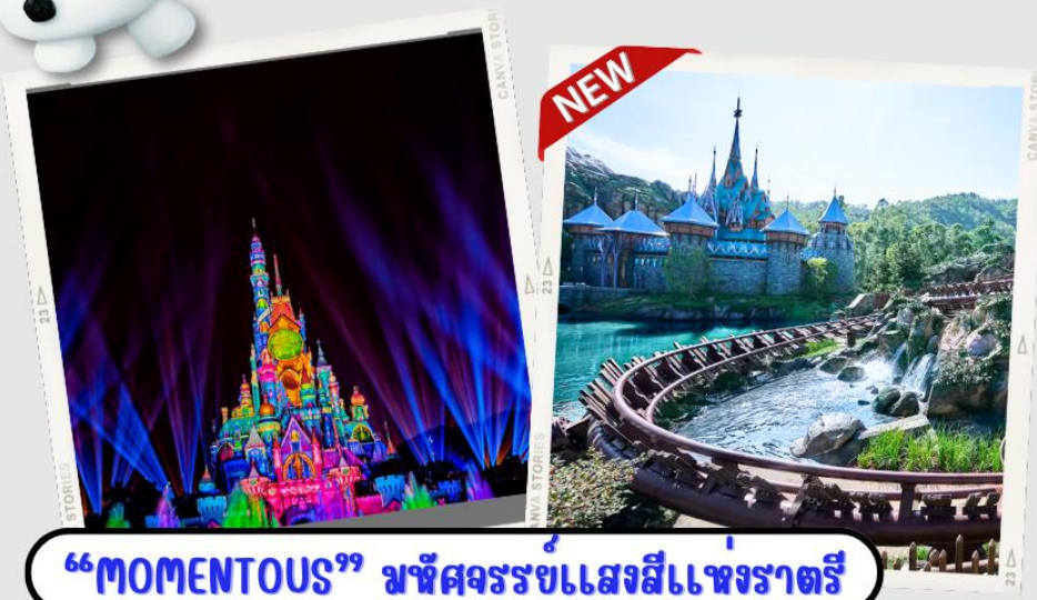
“MOMENTOUS” มหึศจรรย์แสงสีแห่งราตรี