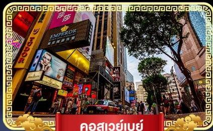
คอสเวย์เบย์