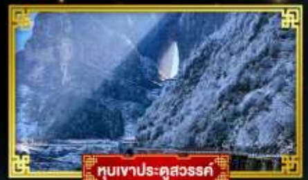
ทิวเขาประตูสวรรค์