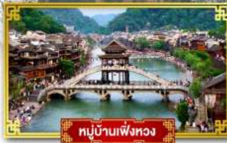
หมู่บ้านเฟิ่งหวง