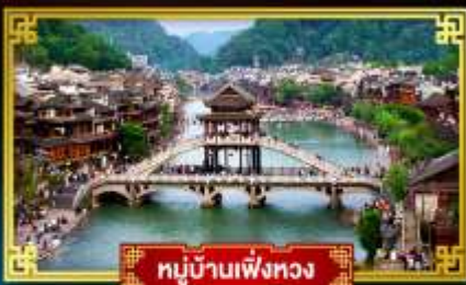
หมู่บ้านเฟิ่งหวง

สุดคุ้ม!! พิเศษ 5 ดาว ทุกคืน เที่ยว 2 เมืองโบราณแดนมังกร