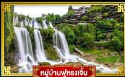
หมู่บ้านฟุรงเจิน