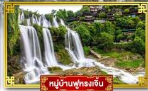
หมู่บ้านฟุ่หลงเจิน