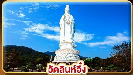
วัดลินห์อั้ง

"พักบานาฮิลล์ 2 คืน" ไฟล์ทสวย "บินเช่ากลับดีก"