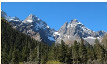
ภูเขาสี่ดรุณี