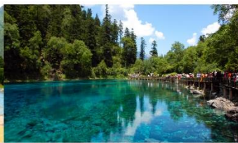
อุทยานแห่งชาติจี๋จ้ายโกว