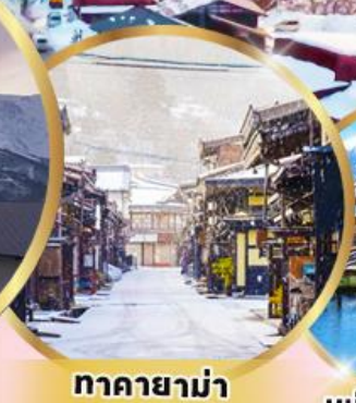
ทากายาม่า