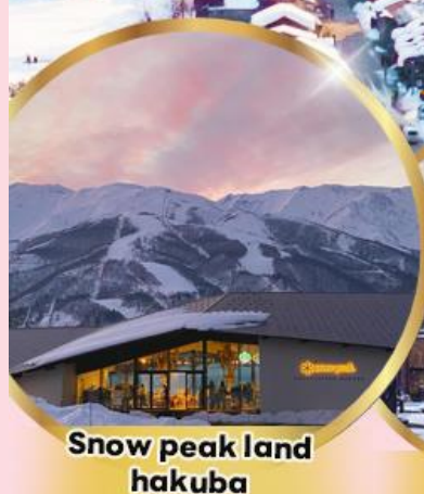
Snow peak land hakuba