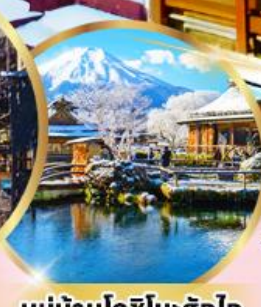
หมู่บ้านโอชิโนะฮักโท