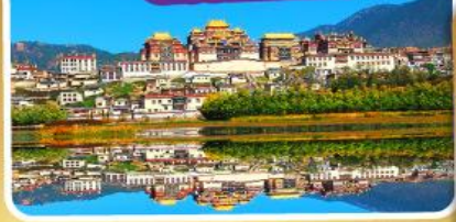
วัดลามะ-เซงจ้านหลิง