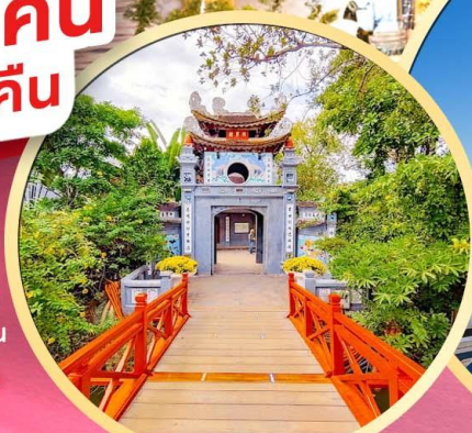
วัดห่งอกเซิน