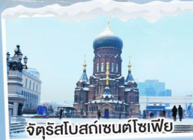
จัตุรัสโบสถ์เซนต์โซเฟีย