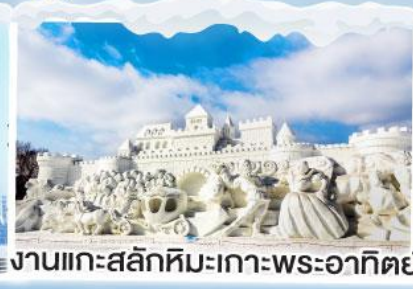
งานแกะสลักหิมะเกาะพระอาทิตย์