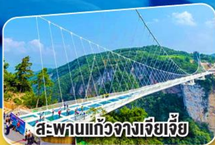
สะพานแก้วจางเจียเจีย