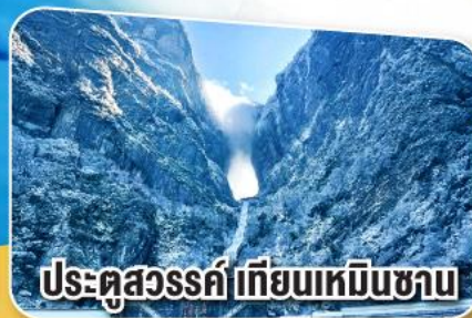
ประตูสวรรค์ เทียนเหมินซาน