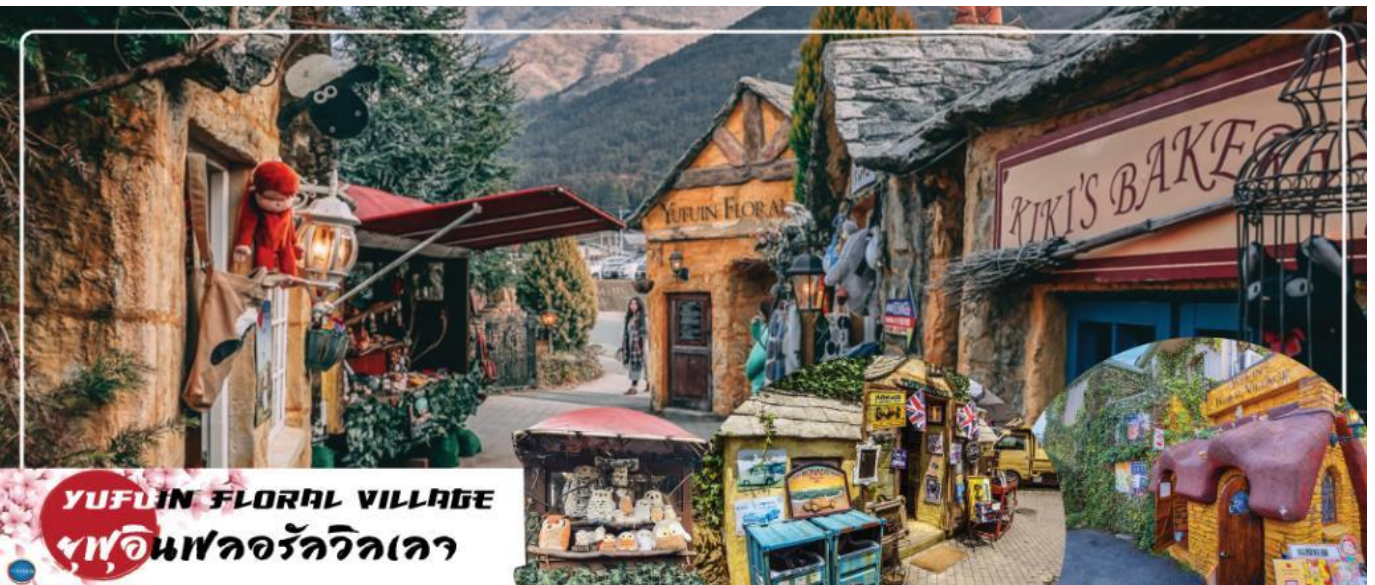
YUFUIN FLORAL VILLAGE หมู่บ้านฟลอร์วิลเลจ

นำท่านสู่ บ่อนรกเบปปุ จิโกคุ เมกุริ (Beppu Jigoku Meguri Or Hell Tour) หรือบ่อน้ำพุร้อนขมมรกตทั้งแปด เป็นบ่อน้ำพุร้อนธรรมชาติที่เกิดขึ้น ภายหลังจากการระเบิดของภูเขาไฟ ประกอบไปด้วยแร่ธาตุที่เข้มข้น เช่น กำมะถัน แร่เหล็ก โซเดียม คาร์บอนเนต เรเดียม เป็นต้น และร้อนเกินกว่าจะลงไปอาบได้ แล้วบ่อทั้ง 8 บ่อ ก็ตั้งชื่อให้น่ากลัวตามลักษณะภายนอกที่เห็น (ให้ท่านเข้าชม 2 บ่อ) นำท่านสู่ เมืองยุฟูอิน (Yufuin) เมืองเล็กๆ ในจังหวัดโออิตะ (Oita) ที่รู้จักกันดีในฐานะแหล่งออนเซ็นชื่อดัง และที่นี่ก็เต็มไปด้วยสถานที่น่ารักๆ มีถนนที่เรียงรายไปด้วยคาเฟ่และร้านขายของเก่า ของกระจุกกระจิกมากมาย ระหว่างทางไม่ควรพลาดที่จะแวะ ยุฟูอิน ฟลอร์วิลเลจ (Yufuin Floral Village) ฮิมปาร์คในบรรยากาศแห่งเทพนิยายที่ดูราวกับกำลังหลงเข้าไปในเหมือนจำลองหมู่บ้านสไตล์ยุโรป ร้านค้าทุกหลังเป็นสีเหลืองที่มีแต่ร้านที่มีสินค้าเป็นเอกลักษณ์ !!! ไฮไลท์ ประจำเมืองยุฟูอิน บ้านอิฐที่แสนคลาสสิกเรียงรายอยู่บนถนนสายเล็กๆ ประดับประดาไปด้วยดอกไม้บานาชนิด ภายในหมู่บ้านมีถนนช้อปปิ้ง มีร้านรวงต่างๆ ที่ตกแต่งได้อย่างน่ารัก ร้านไอศกรีม หรือ คาเฟ่น่ารักๆ อย่าง Alice Tea คาเฟ่สุดชิคบรรยากาศเหมือนอยู่ในป่าและจับน้ำชากับ Mad Hatter หรือจะเป็นร้านขนม ที่มีเค้กวุ้นมาจาก Kiki's Delivery Service กลิ่นหอมของขนมปังอบอวล น่ากินสุดๆ นอกจากนี้ยังมี จุดพักผ่อนหย่อนใจให้แช่ออนเซ็นเท้าอีกมากมาย เดินเลยจากถนนช้อปปิ้งไปท่านจะได้พบความงามของ ทะเลสาบคิริน (Kirin Lake) น้ำทะเลสาบใสเห็นตัวปลาแหวกว่ายในผืนน้ำ บางช่วงมีหมอกบางๆ ลง นับว่าคุ้มค่ากับการมาเห็นความงามนี้ด้วยตาตัวเองสักครั้งนึงอย่างแน่นอน อิสระให้ท่านเดินเล่นและถ่ายรูปตามอัธยาศัย