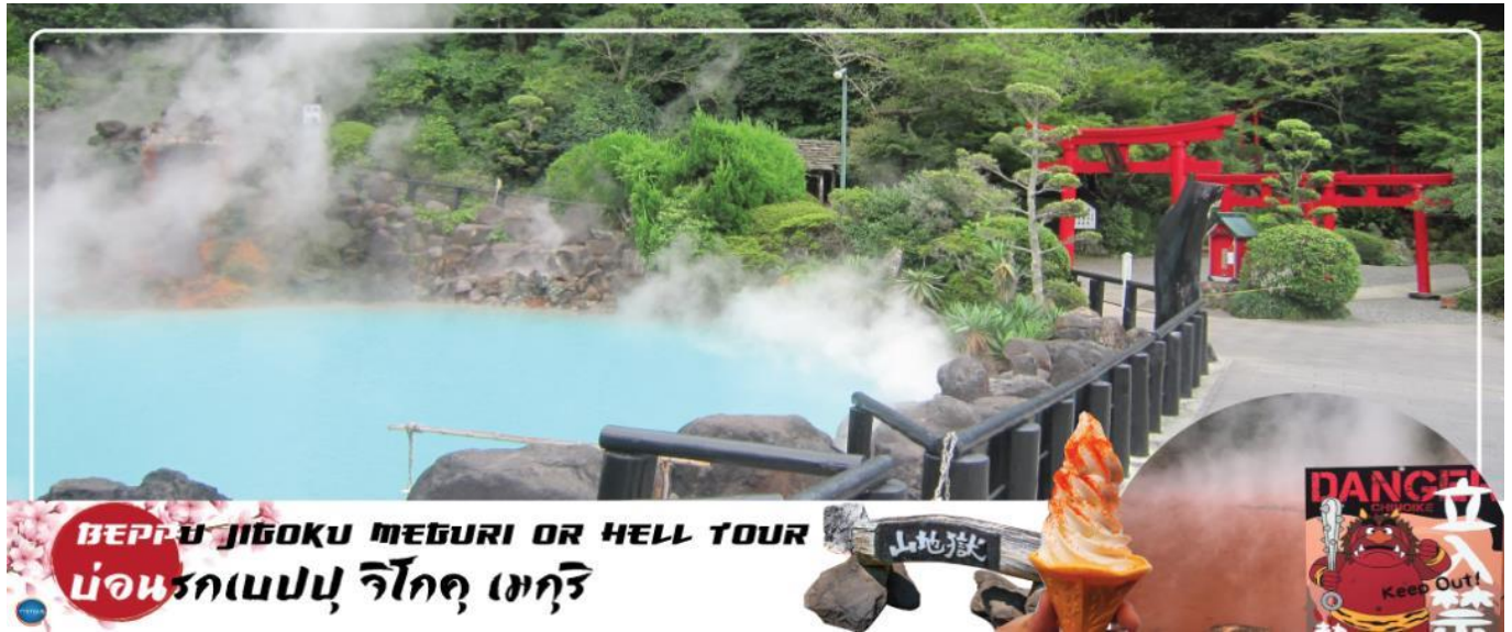
BEPPU JIGOKU MEGURI OR HELL TOUR บ่อนรกเบปปุ จิโกคุ เมกุริ

วันที่สาม เมืองเบปปุ – บ่อนรกเบปปุ จิโกคุ เมกุริ (เข้าชม 2 บ่อ) – เมืองยุฟูอิน – หมู่บ้านยุฟูอิน ทะเลสาบคิริน – เมืองฟุกุโอกะ – ศาลเจ้าอะไซฟูเทมมังกุ – ดิวตี้ฟรี – กันดั้ม ปาร์ค ฟุกุโอกะ