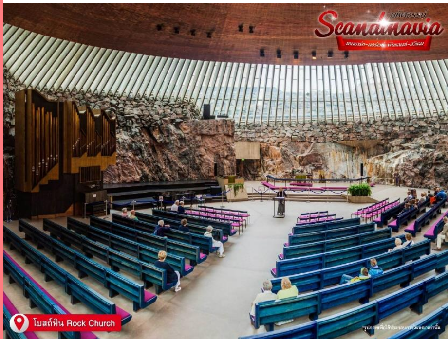
โบสถ์หิน Rock Church

โบสถ์เทมเปลิโอคิโอ หรือ โบสถ์หิน (Rock Church) เป็น โบสถ์ ที่มีสถาปัตยกรรมแปลกกว่าที่อื่น โดยแต่เดิมพื้นที่ของโบสถ์นี้เป็นเนินเขา และผู้ออกแบบได้ใช้วิธีสร้างโบสถ์ที่น่าสนใจ คือระเบิดเนินหินตรงกลางเพื่อสร้าง โบสถ์ในนั้น โบสถ์ที่ได้ขึ้นชื่อว่าเป็น โบสถ์แห่งความรัก และมีความเชื่อว่าเมื่อใครก็ตามจุดเทียน อธิษฐานเรื่องเกี่ยวกับความรักในโบสถ์นี้แล้วจะสมหวังในสิ่งที่อธิษฐาน คนฟินแลนด์มีความเชื่อเรื่องนี้ เนื่องจากโบสถ์นี้สร้างขึ้นเมื่อวันที่ 14 กุมภาพันธ์ 2511 และเสร็จเมื่อวันที่ 14 กุมภาพันธ์ของปีถัดไป เดินทางสู่ จตุรัสเซเนท (Senate