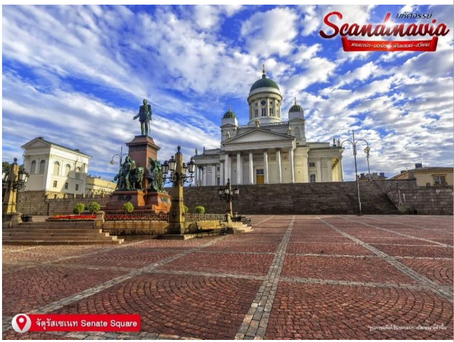
จตุรัสเซเนท Senate Square

Square) ถ่ายภาพอาคารที่น่าตื่นตาตื่นใจรอบๆ จตุรัสขนาดใหญ่แห่งนี้ ซึ่งเป็นศูนย์กลางวัฒนธรรมของเมือง ศาสนาและวิทยาศาสตร์ในเมืองนี้ จตุรัสขนาดใหญ่เป็นการอุทิศให้การออกแบบสไตล์นีโอคลาสสิกสมัยศตวรรษที่ 19 ด้านหน้าโบสถ์มีรูปปั้นพระเจ้าอเล็กซานเดอร์ที่ 2 ที่บริเวณนั้น หอสมุดแห่งชาติเฮลซิงกิ (Helsinki Central library) หน้าอาคารภายนอกสีเหลือง เสาสีขาวและโถงกลมตรงกลาง ในมุมมองวันออกเฉียงใต้ของจตุรัสคือบ้านของเซเดร์โฮล์ม ซึ่งเป็นอาคารหินที่เก่าแก่ที่สุดของเมือง