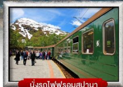
นั่งรถไฟพร้อมสปา

พิเศษ! พักบนเรือสำราญ แบบ Window Room 2 คืน, พักบ้านแซนต้าคลอส