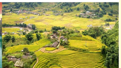
หมู่บ้านต่าฟาน

*กรณีห้องพักรับรองเปลี่ยน ขอสงวนสิทธิ์ในการเปลี่ยนวันเข้าพัก และปรับเปลี่ยนโปรแกรมโดยคำนึงถึงผลประโยชน์ลูกค้าเป็นสำคัญ