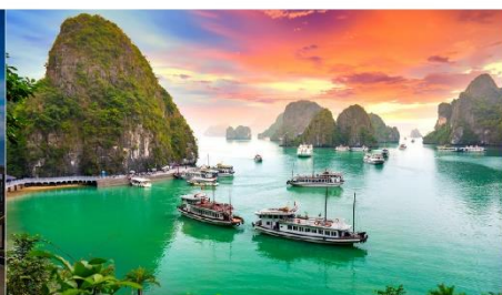
ล่องเรือชมอ่าวฮาลอง