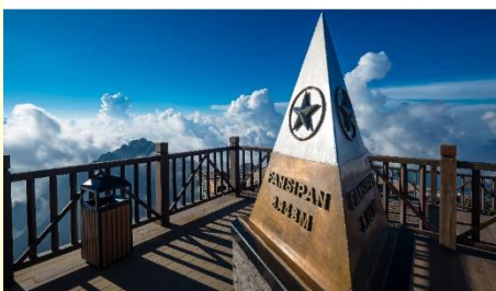
ยอดเขาฟานซิปัน