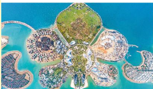
เกาะดอกไม้