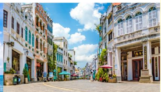
ถนนโบราณฉีไหหลว