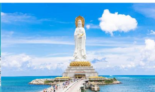
เจ้าแม่กวนอิมหนานชาน