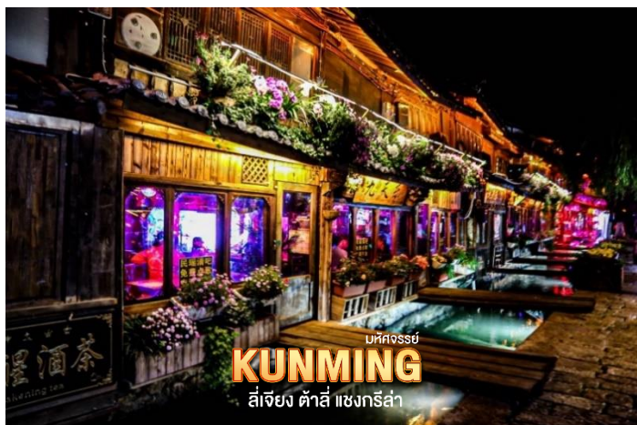
มณฑลยูนนาน KUNMING ลี่เจียง ด้าลี่ แซงกรี่ล่า