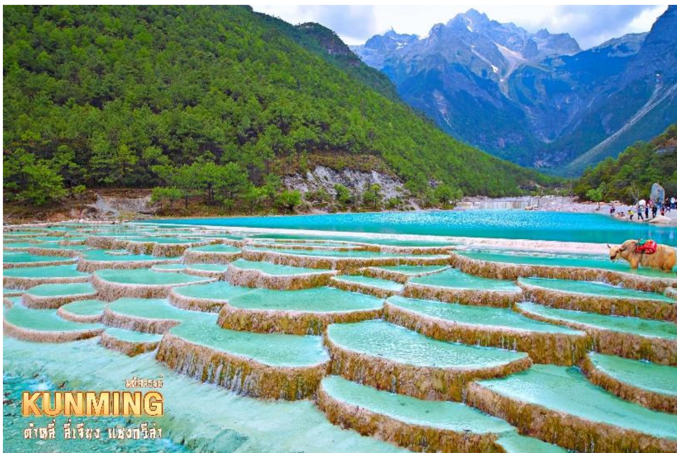
มณฑลยูนนาน KUNMING ต้าตี่ สี่เจียง แชงกรี่ล่า

อิสระถ่ายรูปเก็บความประทับใจอย่างเต็มอิ่ม และชมความงดงามผืนน้ำสีเทอควอยซ์ของ ทะเลสาบไปสุยเหอ ทะเลสาบที่อยู่อีกด้านหนึ่งของภูเขาหิมะมังกรหยก น้ำในทะเลสาบแห่งนี้ไหลลงมาจากการละลายของหิมะบนภูเขาหิมะมังกรหยก สามารถเต็มชมความสวยของทะเลสาบได้ตลอดระยะทาง 3 กิโลเมตร หรือจะเลือกนั่งรถรับส่งได้ตามสะดวกไปยังจุดท่องเที่ยวยอดนิยม ( รวมค่ารถแบตเตอร์ ) ระหว่างทางเดินเลียบทะเลสาบจะพบเห็นคู่รักชาวจีนที่นิยมมาถ่ายพรีเวดดิ้ง และมีเจ้าหน้าที่คอยพาจามริมาบริการให้นักท่องเที่ยวได้ถ่ายรูป ( ไม่รวมค่าบริการถ่ายรูป ราคาประมาณ 50 หยวน )