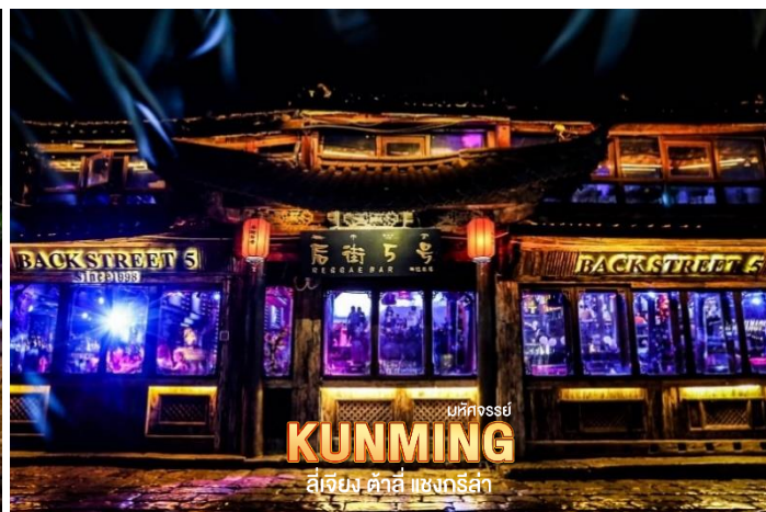
มณฑลยูนนาน KUNMING ลี่เจียง ด้าลี่ แซงกรี่ล่า