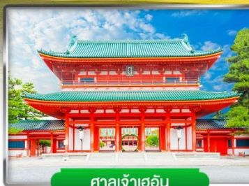
ศาลเจ้าเฮอัน