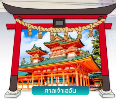
ศาลเจ้าเออนิ