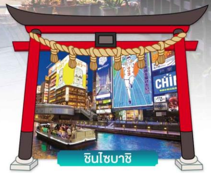
ชินโซบาชิ