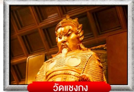
วัดแซงกง