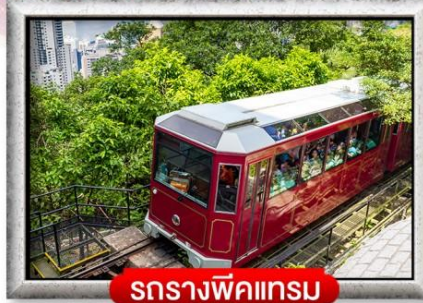
รถรางพิกแตรม