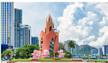
Tram Huong Tower