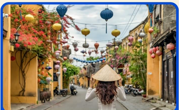
เที่ยวเมืองเก่าฮอยอัน