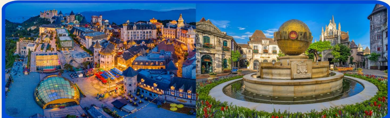
พักผ่อน บานาฮิลล์ 1 คืน