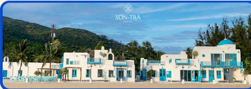
เช็คอินคาเฟ่ SON TRA MARINA