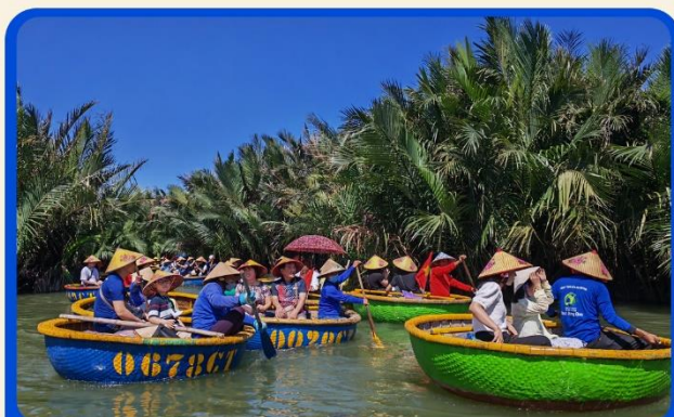
พิเศษ !!! นั่งเรือกระด้ง UNSEEN เวียดนาม