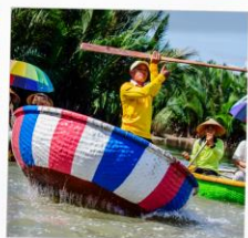
เรือกระดัง