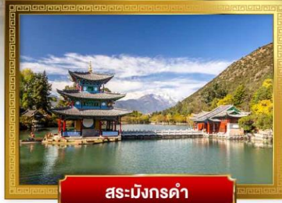
สระมังกรดำ