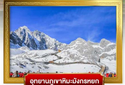
อุทยานภูเขาหิมะ-มังกรหยก