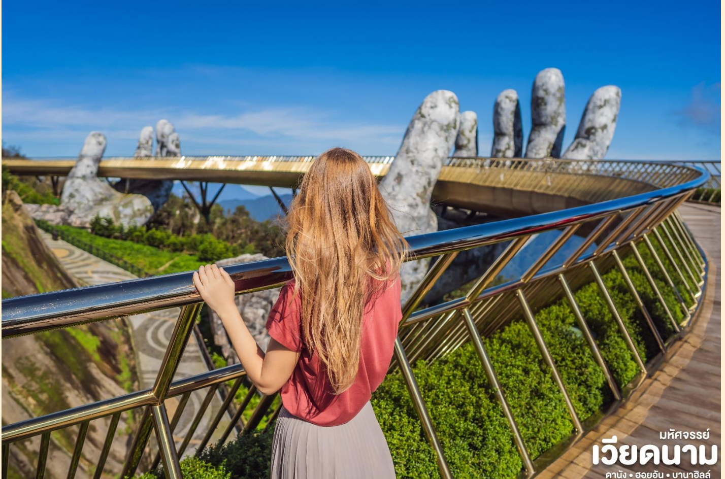
มหัศจรรย์ เวียดนาม คาบัง • ฮอยอัน • บานาฮิลล์

นำท่านชม สะพานสีทอง สถานที่ท่องเที่ยวใหม่ ล้ำสุดตั้งโดดเด่นเป็นเอกลักษณ์อย่างสวยงาม บนเขาบานาฮิลล์ นำท่านสู่จุดที่สร้างความ ตื่นเต้นให้นักท่องเที่ยวมองดูอย่างอลังการที่ซึ่ง เต็มไปด้วยเสน่ห์แห่งตำนานและจินตนาการ ของการผจญภัยที่ สวนสนุก The Fantasy Park (รวมค่าเครื่องเล่นบนสวนสนุก ยกเว้น