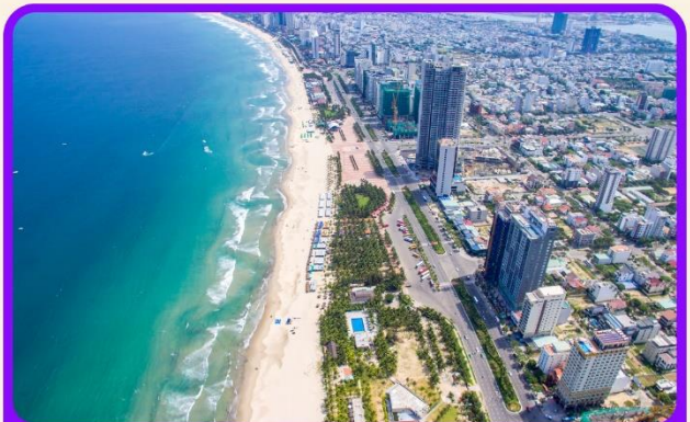
เช็คอิน ชายหาดหมีเคอ เป็นชายหาดที่สวยงามที่สุดในเมืองดานัง