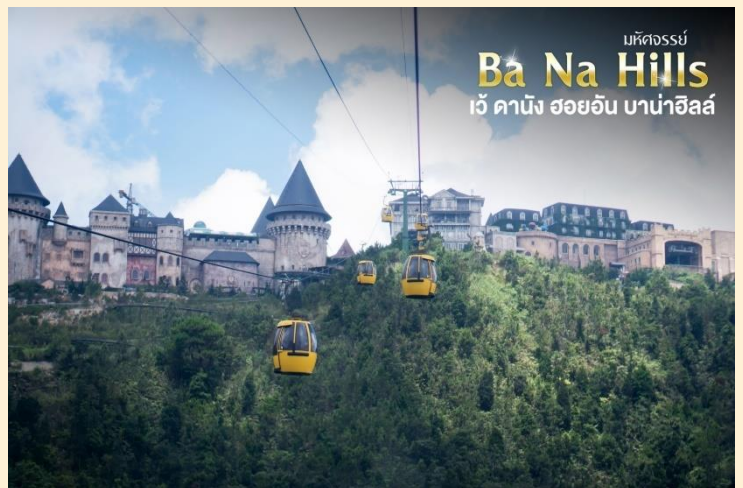
มหัศจรรย์ Ba Na Hills เว้ ดานัง ฮอยอัน บานาฮิลล์

กระเช้าแห่งบานาฮิลล์นี้ได้รับการบันทึกสถิติโลกโดยWorld Record ว่าเป็นกระเช้าไฟฟ้าที่ยาวที่สุดประเภท Non Stop โดยไม่หยุดแวะมีความยาวทั้งสิ้น 5,042 เมตรและเป็นกระเช้าที่สูงที่สุดที่ 1,294 เมตรนักท่องเที่ยวจะได้สัมผัสปุยมะหมอกและบางจุดมี