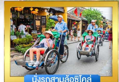
นั่งรถสามล้อซิโคล