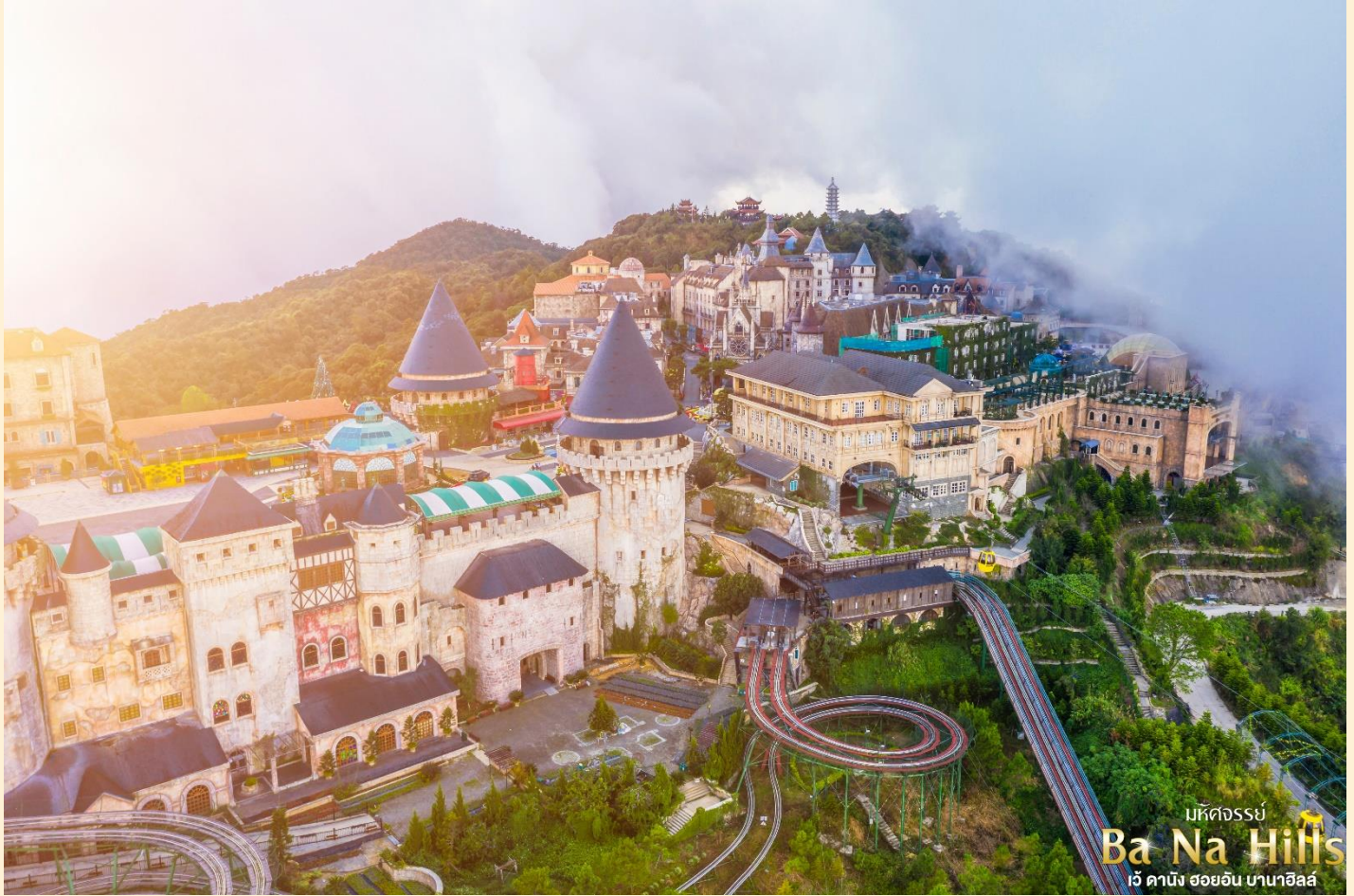
มหัศจรรย์ Ba Na Hills เว้ ดานัง ฮอยอัน บานาฮิลล์

ผ่านการรับรอง ใบอนุญาต เลขที่ 11/10782 เลขประจำตัวผู้เสียภาษี 0105556051339