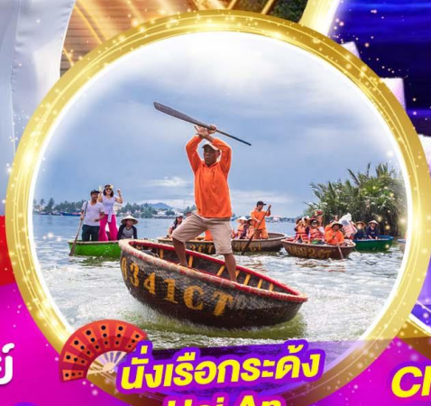
นั่งเรือกระด้ง Hoi An