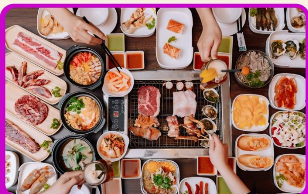
พิเศษ!! เมนูชาฮี+บุฟเฟ่ต์ปิ้งย่าง