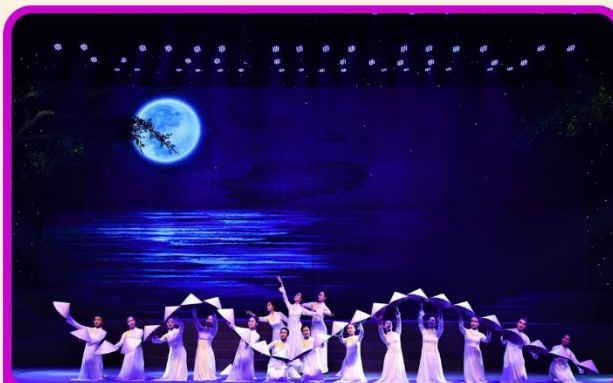
ชมการแสดง Charming Show Danang