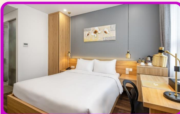
พักเมืองดานัง 4 ดาว 2 คืน