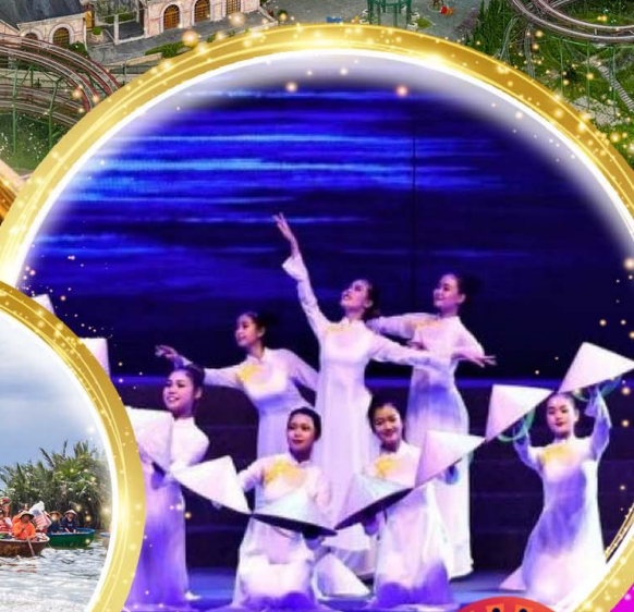
โชว์สุดอลังการ Charming at danang