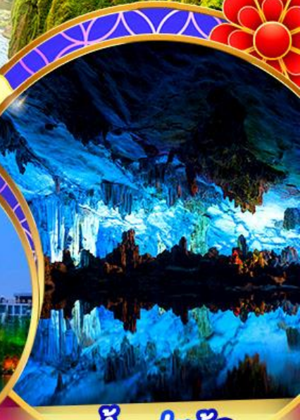
ถ้ำลุย้อ