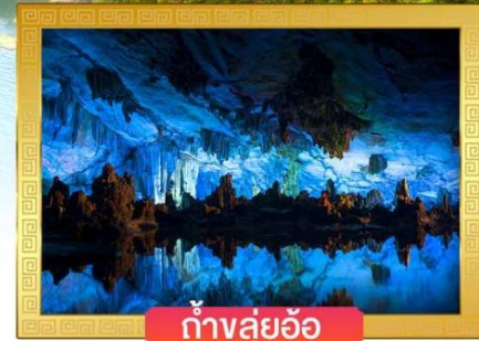
ถ้ำหลุยอ้อ