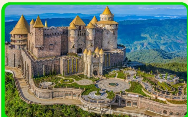
เที่ยวบานาฮิลล์แบบจุใจ เต็มวัน