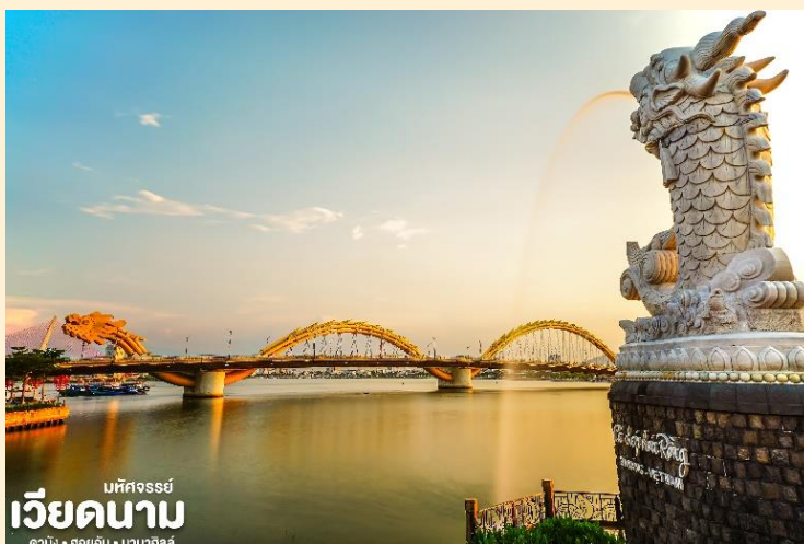
มหิศวรรษย์ เวียดนาม ดานัง • ฮอยอัน • บานาฮิลล์

สะพานมังกรไฟ สัญลักษณ์ความสำเร็จแห่งใหม่ของเวียดนามที่มีความยาว 666 เมตร ความกว้างเท่าถนน 6 เลนส์ เชื่อมต่อสองฟากฝั่งของแม่น้ำฮันประเทศเวียดนาม สะพานมังกรถูกสร้างขึ้นเพื่อเป็น