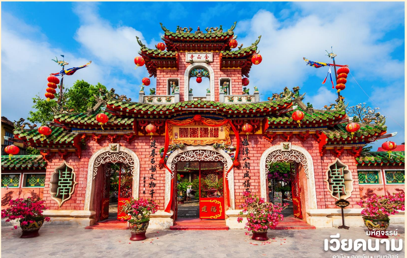
บหัทจรรย์ เวียดนาม ดานัง • ฮอยอัน • บานาฮิลล์

นำท่านชม วัดจีน เป็นสมาคมชาวจีนที่ใหญ่และเก่าแก่ที่สุดของเมืองฮอยอันใช้เป็นที่พักปะของคนหลายรุ่น วัดนี้มีจุดเด่นอยู่ที่งานไม้แกะสลักลวดลายสวยงามท่าน สามารถทำบุญต่ออายุโดยพิธีสมัยโบราณ คือ การนำรูปที่ขุดเป็นก้นหอย มาจุดทิ้งไว้เพื่อ เป็นสิริมงคลแก่ท่าน